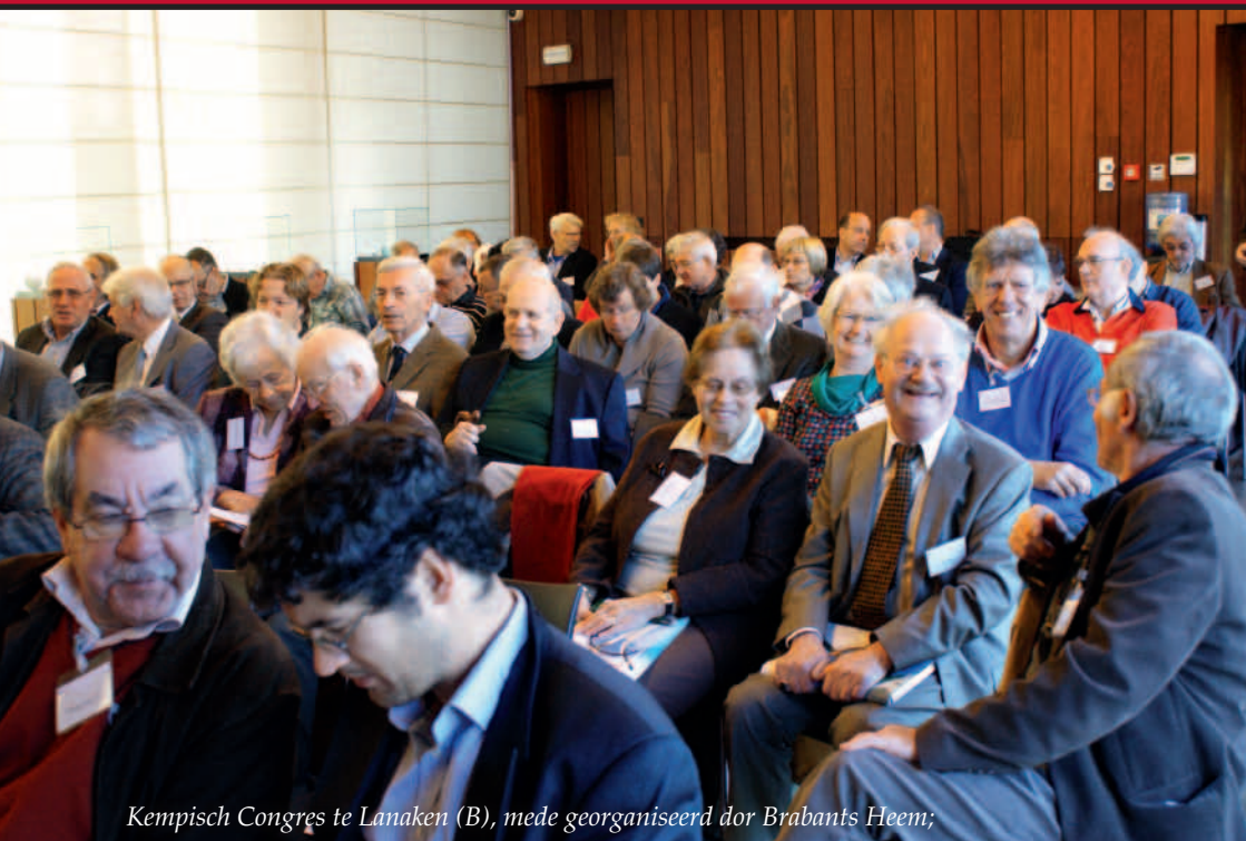
Kempisch Congres te Lanaken (B), mede georganiseerd door Brabants Heem;