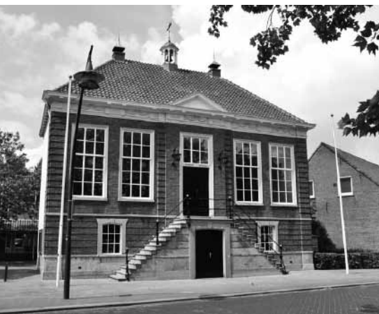
Heemhuis (voormalig gemeentehuis) Erp-Boerdonk-Keldonk