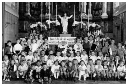
Zolang het nog kan....