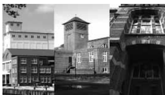
De drie genoemde complexen in volgorde

Brabant. Door herbestemming van deze erfgoedcomplexen worden traditie en vernieuwing aan elkaar verbonden.