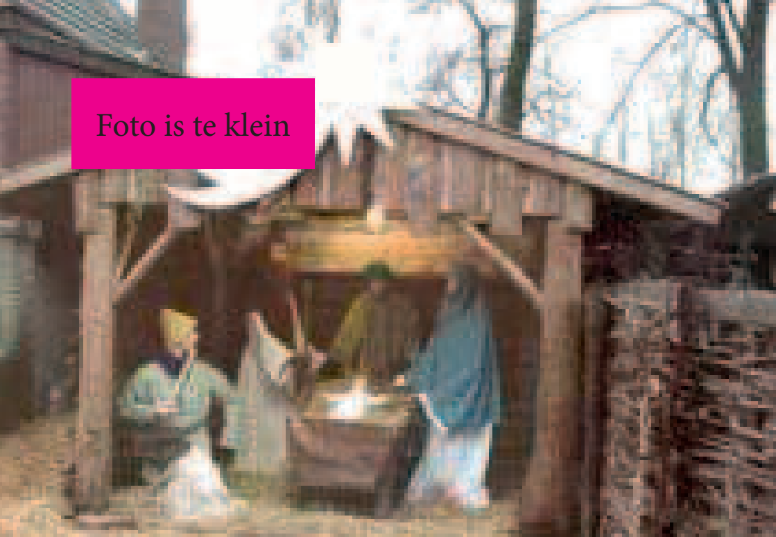
Foto is te klein