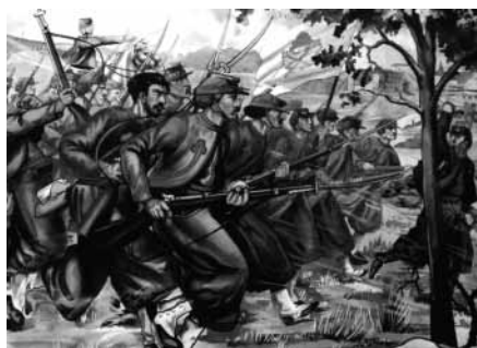
schoolplaat zouaven (Zouavenmuseum)

Nu de gemeenten moeten bezuinigen, zijn de kleine musea vaak het kind van de rekening en daardoor dreigt sluiting van veel van die kleine musea. Een voorbeeld daarvan in de gemeente Oudenbosch. Hier is het Zouavenmuseum gevestigd met de historie van de Nederlandse inbreng in het pauselijke zouavenleger in de negentiende eeuw. Op een steenworp afstand ligt het Natuurhistorisch en Volkenkundig Museum. In dat museum is de collectie te zien die de broeders van Saint Louis bijeenbrachten in de loop van de jaren. Veel kwam uit hun missiegebieden, maar ook uit eigen land is er vooral op natuurhistorisch gebied veel te zien. In 1985 werd een stichting in het leven geroepen om de collectie beter te conserveren en te exposeren. De collecties van de beide musea kwamen van de broeders en die wilden deze collecties voor Oudenbosch behouden.